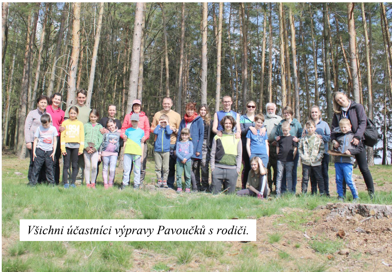
Všichni účastníci výpravy Pavoučků s rodiči.