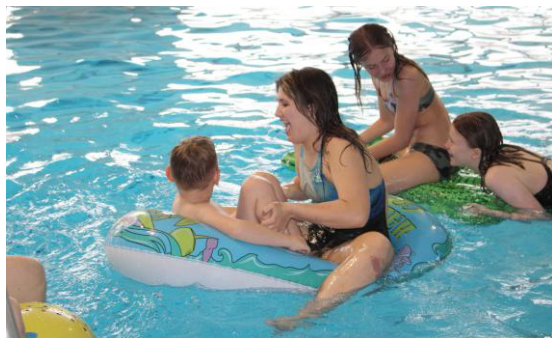
Hříčky ve vodě.

co máme dělat pod vodou, a mohli jsme se potápět.