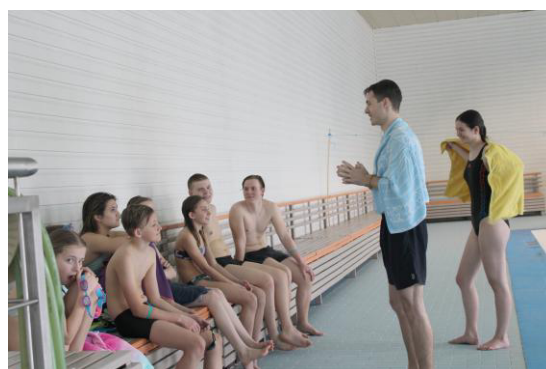
Povídání o první pomoci.