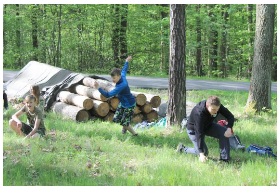
Aby byl přehled, chycení si museli sednout.