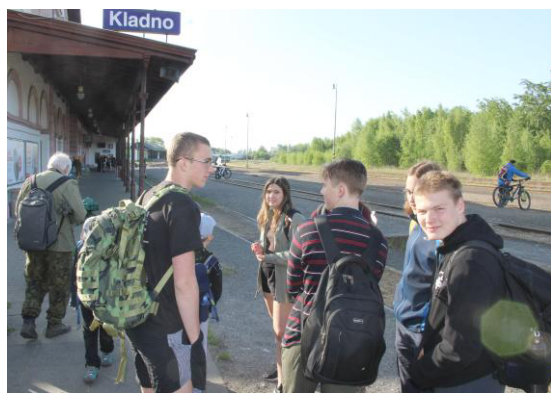
Čekání na vlak.

Dne 14. května nás čekala společná výprava Pavoučků a Lvíčat. Je to speciální výprava, kde se sejdou ti nejmladší a i ti nejstarší z našeho oddílu, takže kdyby se nás sešlo dvacet, mohl by v soutěži ten první získat hezkých dvacet bodů, ať Lvíče či Pavouček. A to by nám to pěkně bodově skákalo. Na výpravu nás ale dorazilo sedmnáct a k tomu čtyři vedoucí.