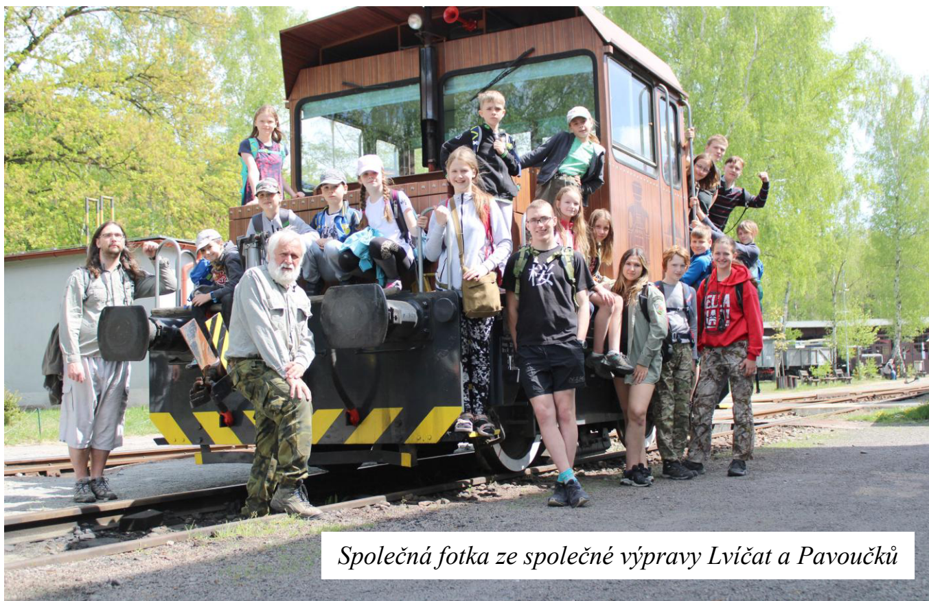
Společná fotka ze společné výpravy Lvícat a Pavoučků