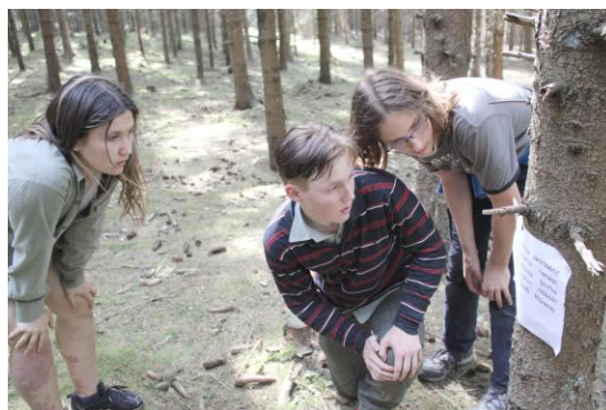
Luštění slov s přeházenými písmeny.

Následovala "Defenestrace", tedy vyhazování z oken, a to i přesto, že okno nebylo v lese ani jedno jediné. V týmu měl jeden člen druhého na zádech, aby se nedotkl země. Muselo se proběhnout trasou a