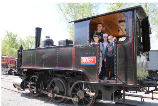
Pavoučci na staříčké parní lokomotivě.

Proč jsme ale zrovna jeli do Lužné? Je tady totiž pěkná expozice vlaků. Tam jsme se po našem soutěžení v lese přesunuli. Byl to pro nás další projektový den, díky kterému náš oddíl dosáhne na další finanční dotace. Rozdělili jsme se zpět na družiny Pavoučků a Lvíčat. Lvíčata se prošla okolo vlaků, přečetla si o nich informace. V muzejní budově nám průvodci vysvětlili, jak to vlastně na dráze funguje. Vypadá to jednoduše, ale co všechno se musí udělat, než vyjede vlak, je ve skutečnosti velice obtížné.