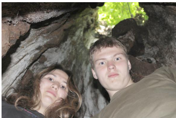
V duté lípě.

Ráno rozdělat oheň, uvařit vodu na čaj a snídat. Všechno probíhalo v naprosté pohodě, a tak jsme celkem brzy opustili naše tábořiště a pokračovali v putování.