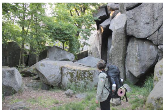
Bonbón u Petrohradských skal.

Pro dnešek jsme měli zajímavosti vybrané, pokud ovšem jako zajímavost nepovažujeme samotné Petrohradské skály, kde jsme nocovali. Zdejší roztroušené balvany jsou vyhlášenou boulderingovou oblastí, což je lezení bez jištění.