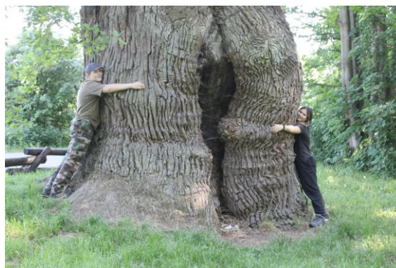
Ten ve dvou neobejmete. Má obvod více než devět metrů.