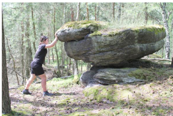
Bonbón hýbající viklanem.

Pokračovali jsme dál k poslední zajímavosti dnešního putování, což je viklan. Ne ten známý Jesenický, ale utajený menší, nicméně stále dosti velký