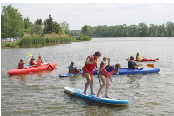
Lvíčata a vodní živel.

Hned brzo ráno nás čekalo všechno si sbalit a vyrazit auty směr Záplavy. Bylo pro nás překvapení, že jedeme právě sem, a nikdo netušil, že celý den budeme v lodích na vodě.