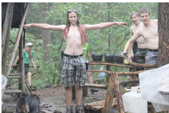
Trošku jsme zmokli.

Nad námi se znenadání objevila mračna, která sice vypadala, že by z nich něco mohlo kápnout, ale nelámali jsme si s tím zbytečně hlavu a začali hrát další soutěž. Zahráli jsme si přehazovanou, kdy