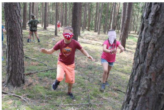
Druhá soutěž etapové hry O perníkové chaloupce.