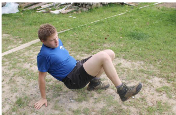
Kvítek jako rak.

Musím říct, že den u vody byl báječný. Ale protože jsme hráli jenom týmové hry a na prvním místě tak bylo několik lidí, musela se dát poslední soutěž pro jednotlivce. Museli jste překonat dráhu, ovšem museli jste jít jako raci, pak oběhnout hromadu hlíny, skákat v pytli jako klokani a pak pozadu k cíli. Taky byste řekli, že nejlepší byl Klokan, když se tam skákalo jako život, ale ne, nejlepší čas měla Bonbón. A tak se přiblížil úplný konec pro některé z nás až pětidenní výpravy.