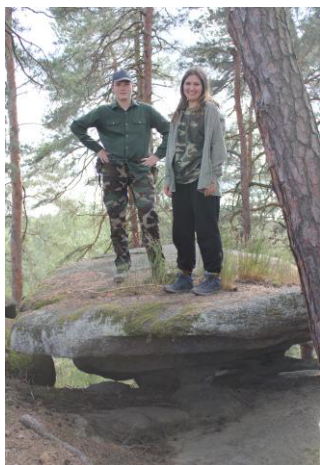
Kvítek a Bonbón na podivném kameni.

Po mnoha letech byl závěr soutěže družin Lvíčat o vícedenní výpravy dramatický a Ropáci o tom, že mohou jet na čtyřdenní výpravu, rozhodli až poslední den této soutěže.