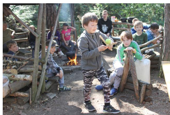
Udržet tenisák mezi těmi polínky, to nebylo až tak lehké.