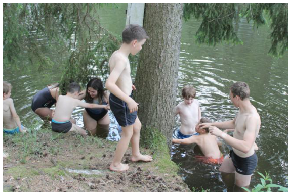
Koupání v jezeře.