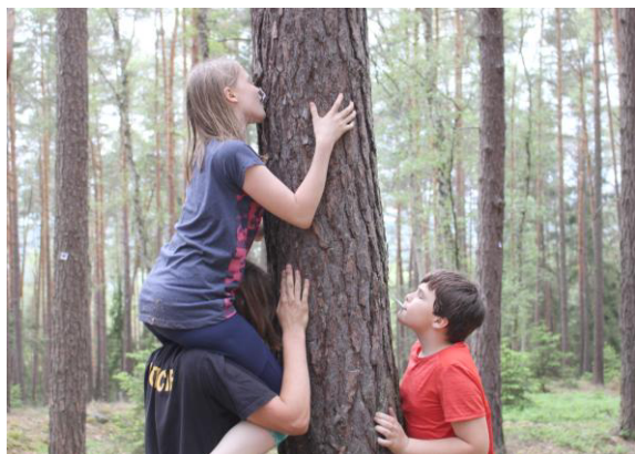
Zajímavé získávání lístečků.

Další úkol byl postavit za pět minut co nejvyšší hranici, s co nejvíce patry. Nejvíce pater postavili Mufici, kteří opět vyhráli.