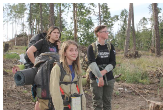
Kudy dál, kamarádi?