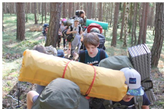
Výstup na Borůvku.

Vyčistit zuby, přinést další dříví, to všichni jsme už spálili, uvařit na ohni čaj a pak snídaně, rohlík s marmeládou.