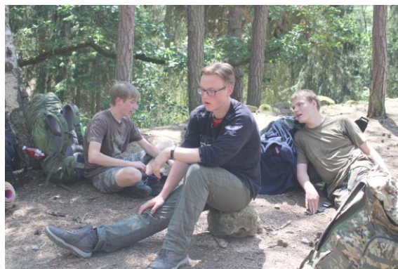
Konečně v cíli, na Borůvce.