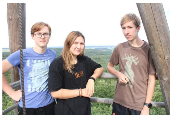
Noví instruktoři Pavoučků Klokana, Bonbón a Kulik.

Tak kamarádi, hodně štěstí, hodně povedených akcí, ať se vám tahle práce líbí.