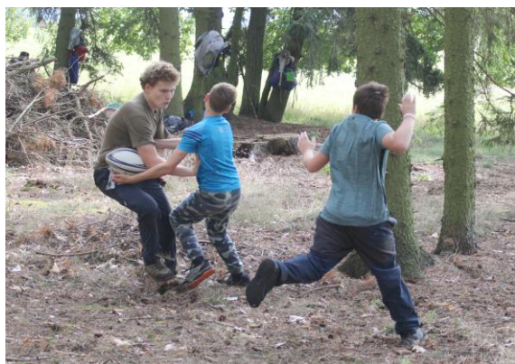
Americký fotbal v Českém lese.