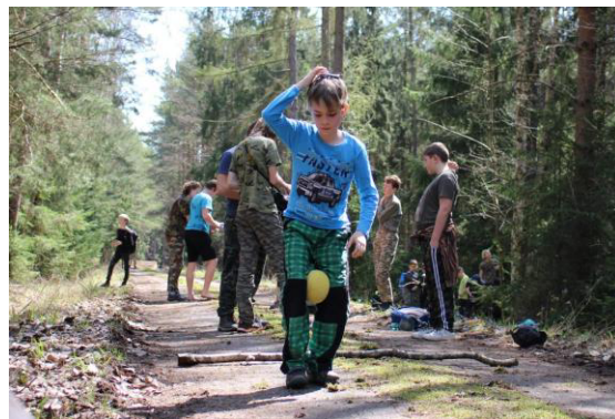
Ondra jako Charlie Chaplin.

Došli jsme na cestu, která byla vhodná pro další soutěž, což bylo skákání snožmo v pytli. Byla to další týmová soutěž, týmy si určily pořadí a po jednom měli obskakat kolem Bastiho. Poté, co doskákával poslední člen, tak se zastavil čas. Konalo se pouze jedno kolo. Nejrychlejšími skokany se stali Kvítkovci.