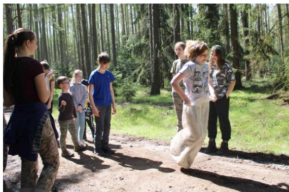
Skoky v pytli.

První soutěž, která nás čekala, byla týmová letadélka v mlze. Spočívalo to v tom, že celý tým si zavázal oči a vždy jeden z krajních se musel držet stromu, cíl je stejný jako při klasických letadélkách v mlze, dostat se co nejdříve k vedoucímu, který fouká na píšťalku. To se právě povedlo jako prvním Matesovcům.