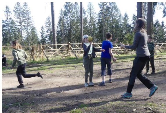
Soutěž družstev s míčem.

Po této soutěži jsme zůstali na tom samém místě ještě na tři hry. První z her byla hříčka lovec s lukem. Lovec stojí na předem určeném místě a zvířátka se snaží dotknout se lovce, lovec je ale svým lukem může zasáhnout a takové zvířátko se vrací na start a může jít znovu. Do posledního kola nastoupili dva lovci, jeden od Pavoučků, druhý od Lvičat.