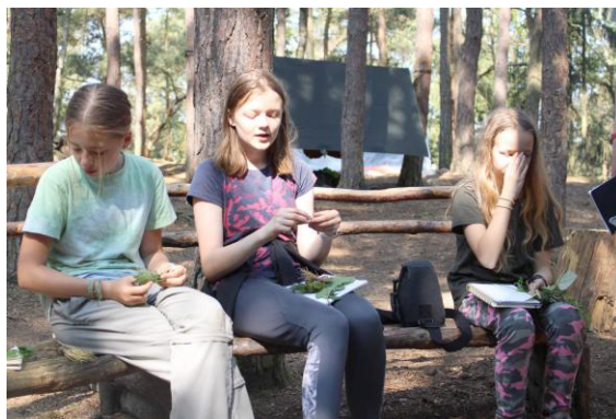
Hodnocení sesbíraných rostlin.