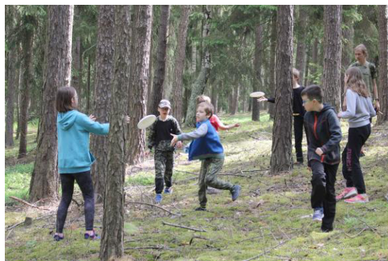
Soutěž s létajícími disky.

Soutěže pro jednotlivce doprovázela i malá etapová hra pro čtyřčlenná družstva, která měla vždy tři členy, to proto, že Maf se odmítal účastnit jakéhokoli programu, takže pouze seděl a sledoval činnost ostatních. Také si z této výpravy odvezl všehovšudy pouhých devatenáct bodů.