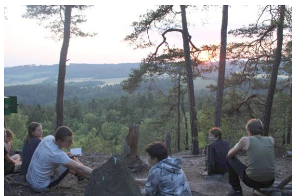
Když zapadá sluníčko.

Po této soutěži nastal čas jít se podívat na západ slunce.