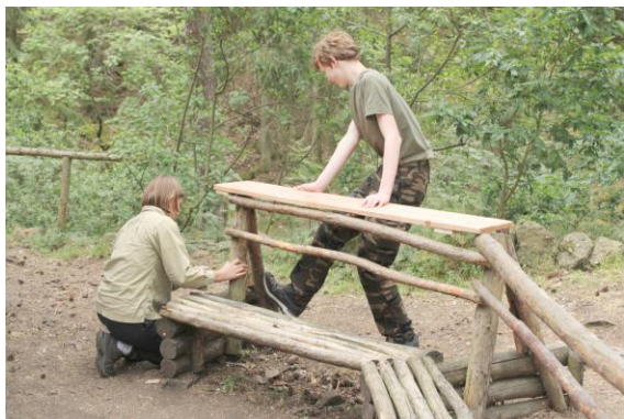
Nový stolek na kotlíky s čajem.

Viklan byla naše poslední zastávka, a proto jsme se vydali směrem na Borůvku.