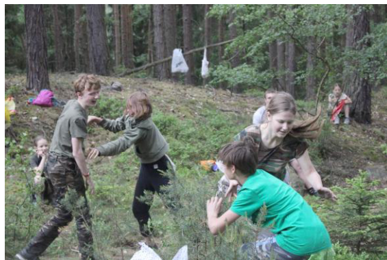
Boj zblízka - boj o šátky - liščí oháňky.

Při cestě s kanystry jsme se zastavili na další etapu. Naše kolegy, kteří již kolonizují na planetách, přepadly opice. My, jako budoucí kolonisté, jsme se měli připravit na boj na blízko a na boj s pokročilými technologiemi, abychom jsme se ubránili. Nejprve jsme hráli boj na blízko, což představovaly liščí oháňky. Během soutěže nás přepadla žízeň. Voda, kterou jsme nesli na Borůvku ze studánky, vedoucí vyhodnotili jako vodu, která vyžaduje převaření. Proto jsme se vydali na Borůvku se napít.