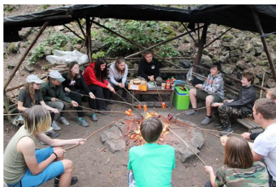
K večeri byly buřty.