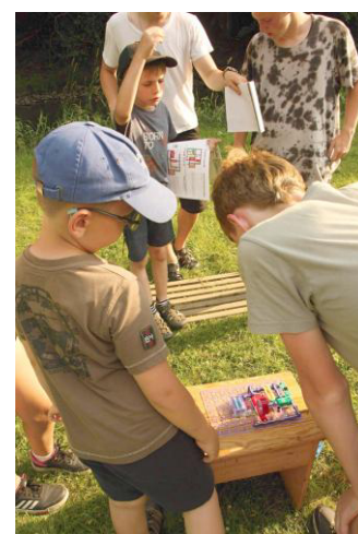
Výroba kódovacího terminálu.

Těžko ale vypočítat vše, co jsme letos na táboře zažili. Vždyť jsem zatím nezminil ani náš výlet do plzeňské Techmanie, ani výsadek v neznámém terénu, ani co vše se událo u závěrečného táboráku. Můžu však s klidem prohlásit, že tábor všichni vedoucí hodnotí jako povedený a už spřádají plány na příští rok.