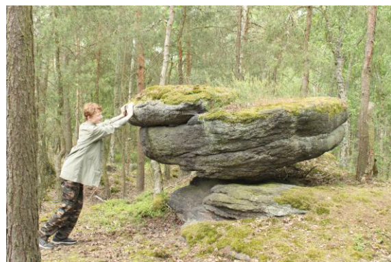
Tím kamenem jde opravdu pohnout.