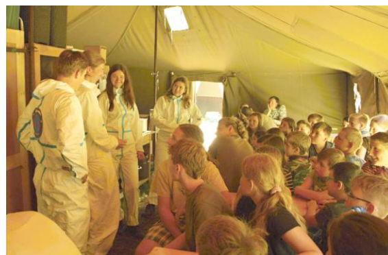
Vesmírná mise začíná.

Pod taktovkou Bastiho a Pomněnky byli všichni účastníci uvedeni první scénkou do letošní celotáborové hry „Pád do Σ Draconis“. Na tu navazovala úvodní etapa našich letošních vesmírných cestovatelů. Jejich cílem bylo odcestovat v rámci mise Osiris na vzdálenou planetu Euphorii, kde se měli přidat k probíhající operaci vedoucí k záchraně lidského druhu. Planeta Země totiž skomírá a přesídlení na novou planetu je jedinou nadějí. Jak vás ale asi napadá, přesun nešel podle plánu. Posádka se totiž musela po cestě potýkat s útokem nepřátelských diverzantů. Při té příležitosti byly postupně prozkoumány všechny místnosti lodi Hellstern a v rámci pár etap dokonce i její venkovní části.