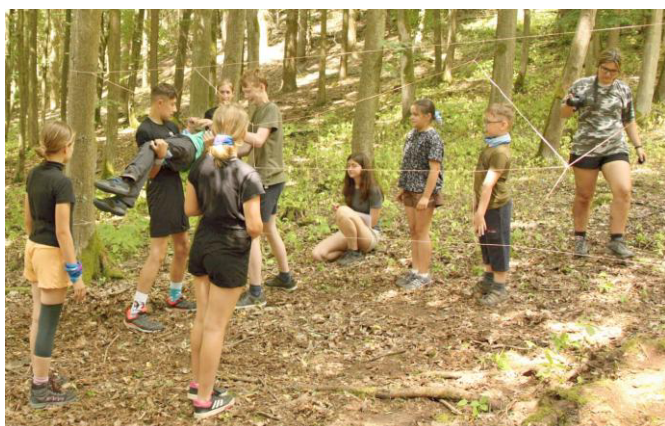
Etapovka - prolézání do jídelny.

Po značném úsilí, zranění i zradě ve vlastních řadách byli nicméně všichni diverzanti pokořeni. Bylo však třeba ještě obnovit loď do funkčního stavu a navést ji na správný kurz. Konečně se to povedlo a posádka dorazila do vysněného cíle, kde si mohla vychutnat pohostinnost jejich nového domova.