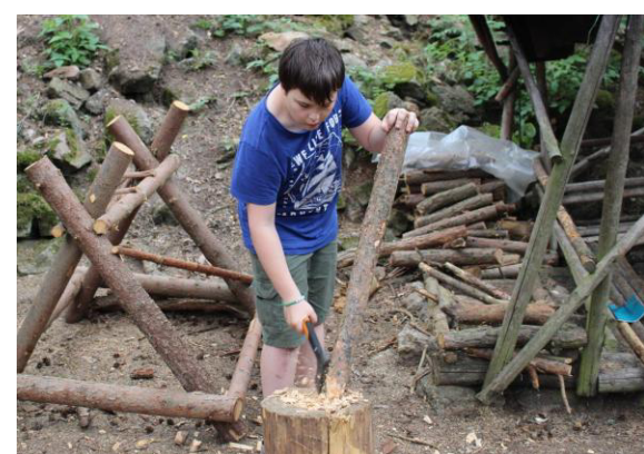
Postrach vyrábí kolík pro nové zábradlí.

Než jsme se šli naobědvat, Bahňák nás poprosil o pár drobností, které bylo zapotřebí udělat na Borůvce. Největší úkol bylo udělat nahoře nad Borůvkou zábradlí, aby se zamezilo projít dolů k Borůvce po svahu. Nahoru vylezli Kvítek, Honza a Pomněnka, kteří nahoře dělali zábradlí. Dole ostatní řezali, nosili dřevo, nebo vyráběli kůly na zábradlí.