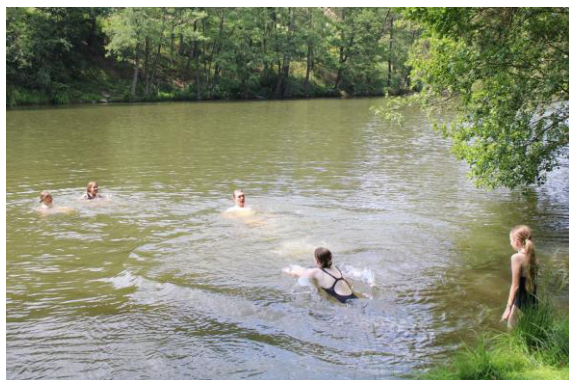
Koupání v jezeře.