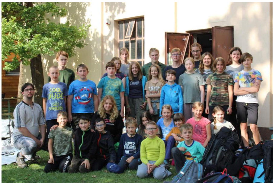
Jedenáct Lvícat, jedenáct Pavoučků a osm dospěláků. To jsou účastníci společné dvoudenní výpravy našeho oddílu.

Probudili jsme se do chladného rána, vyčistili jsme si zuby, a protože jsme již měli nedostatek dřeva, museli jsme pro něj do lesa. Když byl dostatek dřeva, již jsme mohli dát vařit vodu na první čaj. K snídani se podávala paštika s rohlíkem.