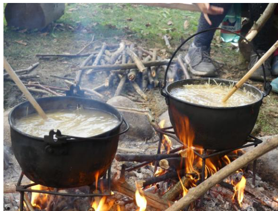
Když se vaří špagety.

A zas byl čas vařit oběd. Rozdělali jsme si dva ohýnky a začali jsme vařit vodu na špagety. Každý z nás měl svůj úkol, někdo lámal dřevo na oheň, další přikládal, další míchal a dva z nás lámali špagety, protože lžící bychom je dlouhé sníst nezvládli. Poslední z nás otevíral konzervy. Když jsme měli hotovo, šli jsme se najíst, i přesto že jsme měli veliký hlad, nám spusta špaget zbyla dojídali to po nás Lvíčata a vedoucí.