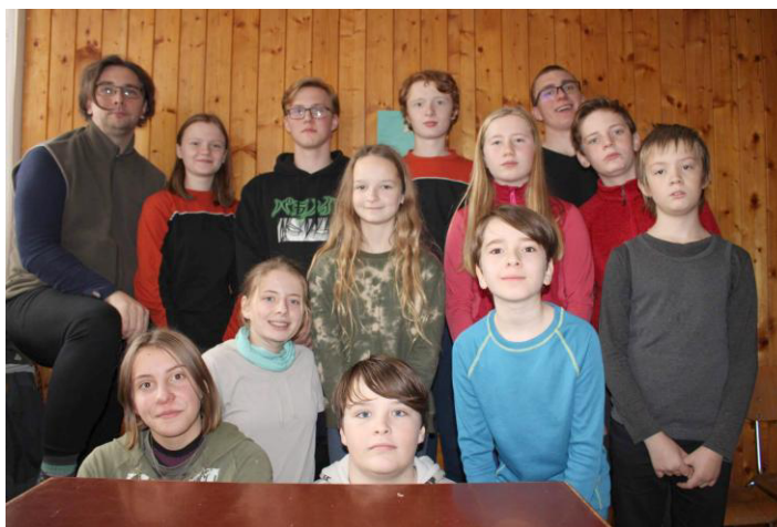
Zleva jsou: Bahňák, Anička, Klokán, Terka, Honza, Emma, Basti, Vojdan a Hugo. Dole pak Kája, Týna, Postrach a Ondra.

Cestou ke kostelu jsme si našli stromy, na které jsme měli vylézt a vydržet