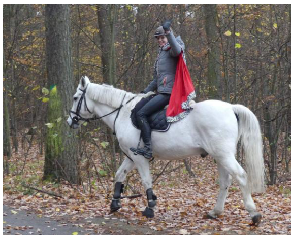
Na své výpravě potkali Pavoučci svatého Martina na bílém koni.

Pak každý Pavouček předložil nasbírané listy. Jelikož to bylo na body, kdo kolik má listů, tolik bodů dostane, neurčovalo se pořadí, ale nejvíc bodů měli Fanda a Artuš.