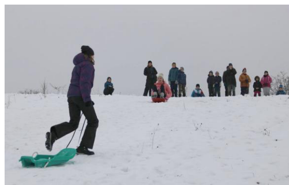
Boby nahoru a sjet dolů.