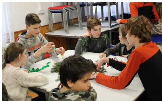
Výroba vánoční ozdoby.