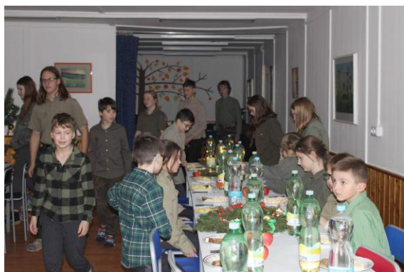
Nástup ke štědrovečerní tabuli.

Potom jsme měli oběd a byl guláš s těstovinami. Po obědě lvíčatovští kluci šli mýt nádobí a ostatní měli volno. Potom nás vedoucí svolali a řekli nám, že nastal čas, abychom vyrobili svoji (týmovou) ozdobu. Tři týmy vyráběly věnec a čtvrtý tým vyráběl svícen. K dispozici jsme měli přírodniny, co rostly v areálu, výtvarné potřeby, co přivezli vedoucí, a vlastní věci.