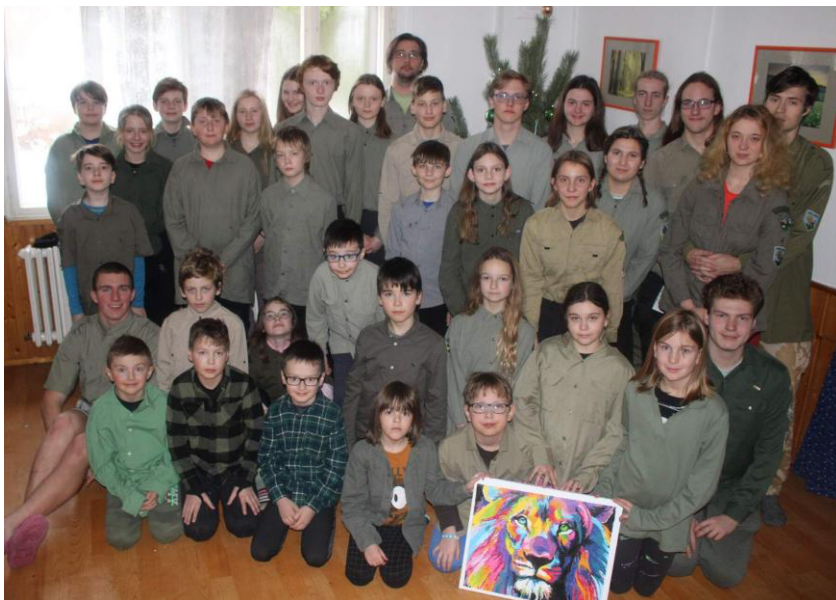
Účastníci vánoční výpravy Lvícat a Pavoučků 2023.