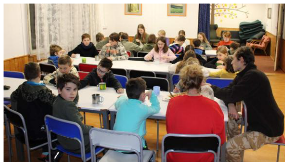
Večeře na základně.