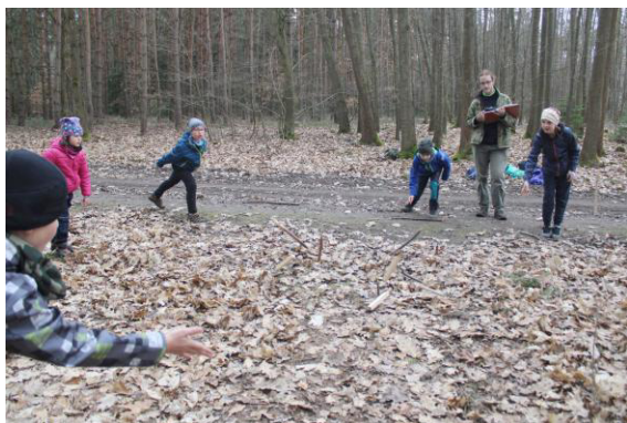
Výkonnostní kolíky letí k cíli.