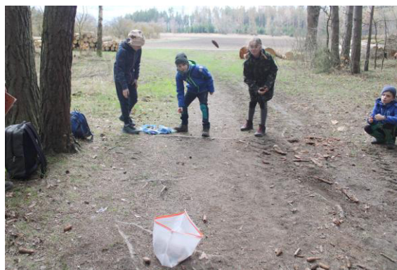
Další šiška letí do určeného cíle.