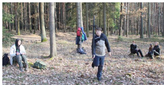
Postrach a balancování s mečem s tím, že se stojí jen na jedné noze.

Po této hře jsme se vydali zpátky ke kostelu, kde se vyhlásily výsledky. Tuto výpravu Lvícat vyhrála Karla.