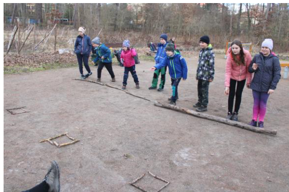
Turnaj v házení šišek na určený cíl.

Když Ryba začal připravovat herní prostor pro další soutěž, měl to být dokonce turnaj, ve kterém se utkal postupně každý s každým, začalo pršet. Oblékli