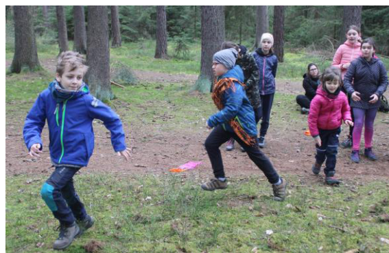
Hledání lístečku s určeným zvířátkem.