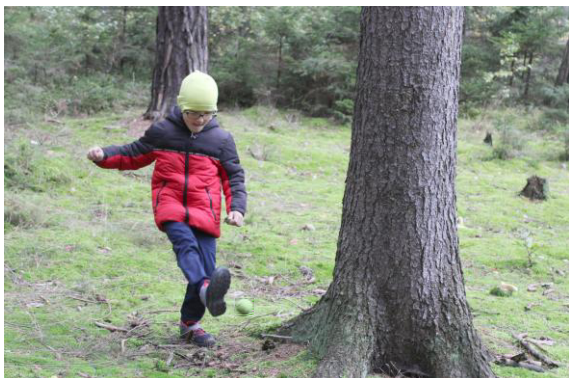
Rost'a při kopání míčku.

kterého rozdělil těm, kteří nezískali nic, a nevynechal ani instruktory, kteří se soutěže nezúčastnili.