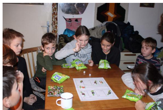
Boj o cukrátko.

Následovala hra, při které jsme použili hned dvě šestistěnné kostky a hrací plán, na kterém bylo jedenáct polí s čísly od dvou do dvanácti. Každý Pavouček dostal pytlík s bonpari, které se staly jakýmisi herními žetony. Hráč, na kterém byla řada, hodil dvě kostky, na kterých mu padlo v součtu kupříkladu číslo osm. Pokud na herním plánu bylo políčko osm obsazené bonpari, hráč se stal jeho majitelem. Bylo-li ale políčko prázdné, musel tam ze svých zásob jeden bonbón vložit. Výjimkou bylo políčko s číslem sedm. Tam odtud se nevybíralo. Vlastně vybíralo. Ale to musely někomu padnout na obou kostkách buď dvě jedničky, nebo dvě šestky. To pak bral úplně všechno, co v ten moment na herním plánu bylo. Takový šťastlivec ovšem házel ještě jednou, a pokud mu opět padlo v součtu dva či dvanáct, musel do každého pole vložit jedno cukrátko. To se tentokrát ale nikomu nestalo. Každý hráč měl možnost kdykoli odstoupit a nepokračovat, ovšem pak se již do hry nemohl vrátit.