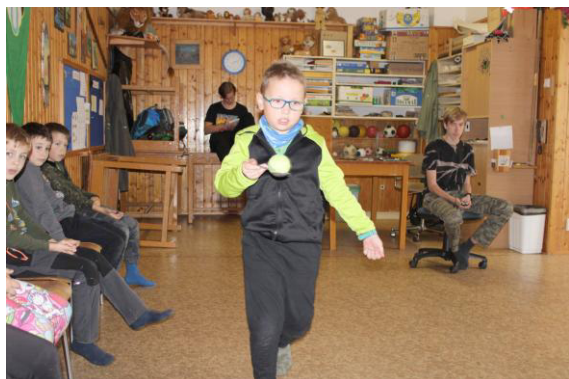
Domča při běhu s tenisákem na lžici.

věžičkami byl ještě prostor pro hráče, který měl za úkol tenisovými míčky shodit věžičky soupeřovi dříve, než to udělá on mně. Každý souboj se hrál na dvě výhry a postupně se v turnaji prostřídal každý proti každému. Vítězství tady patřilo Fandovi.