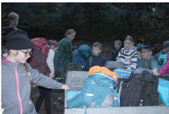
Batohy na záda a jde se do chaty.