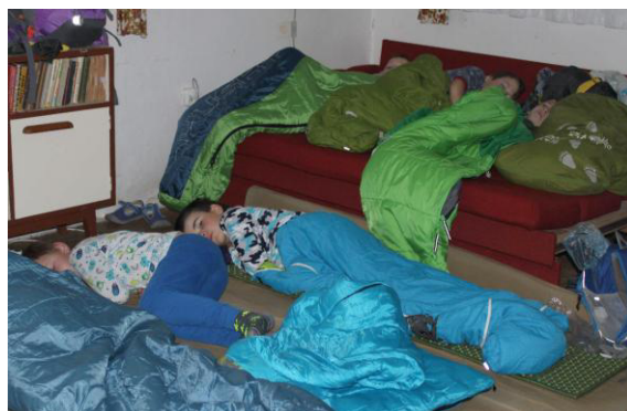
Pohled do chlapecké „ložnice“.