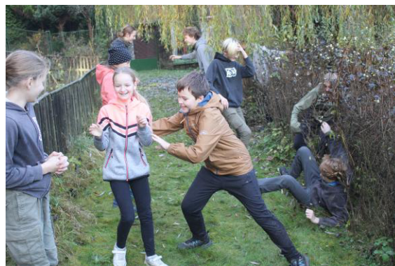
Boj o koryta.