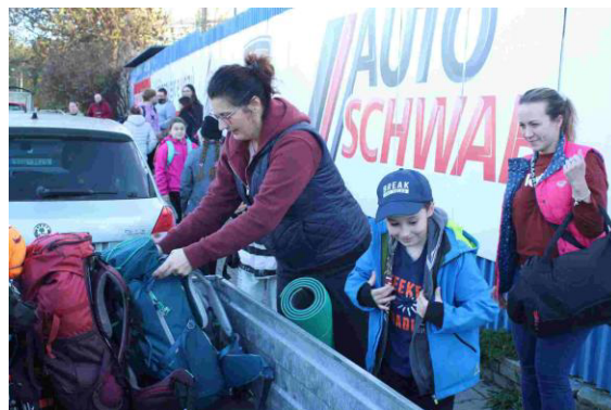
Maminky při nakládání batohů na vozík.

K této výpravě jsme se sešli na parkovišti poblíž zimního stadiónu, odkud jsme ze zastávky autobusu odjeli v doprovodu dvou našich instruktorů přes Bratronice na zastávku Mostecký mlýn, kde se k nám připojili Hanikulík s Kulikem, kteří nás odvedli necelý kilometr a půl k Tumajově chatě.