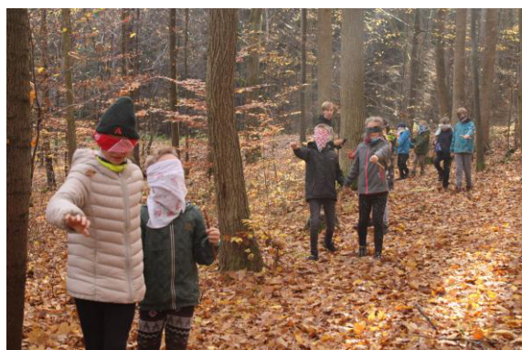
Finálová etapa naší etapové hry.