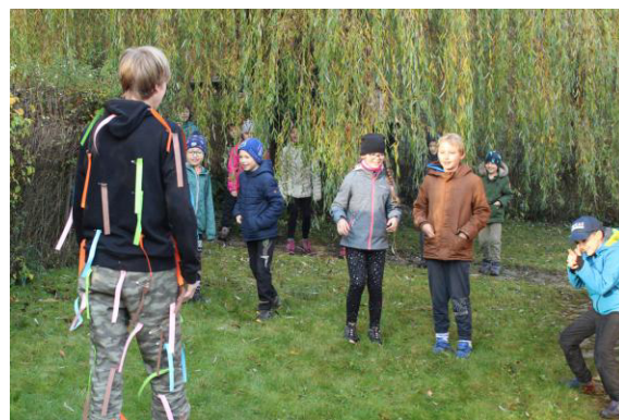
Škubání pírek vzácného ptáka.