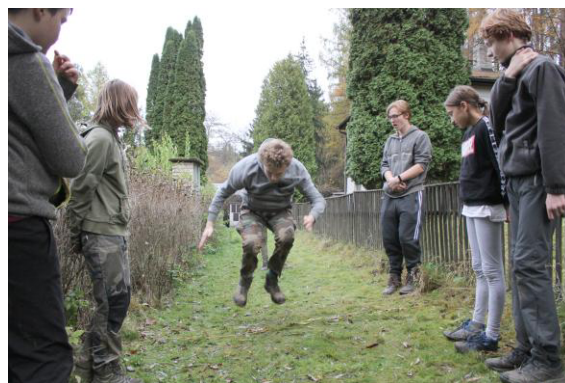
S - jako skákání.

na kládě. Následovala klasika na písmenko L, a to Letadla v mlze. Předposlední hrou v lese pro toto