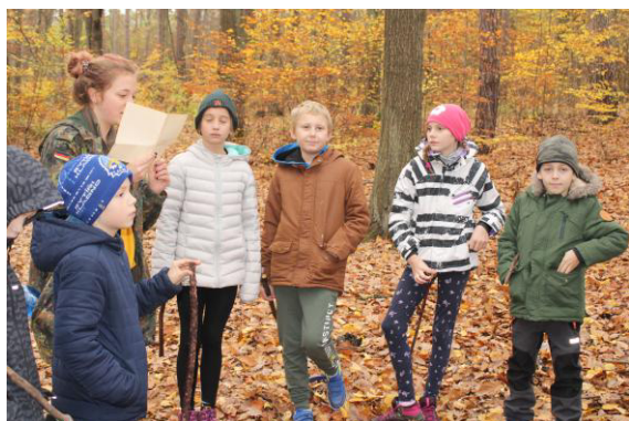
Hanikulik čte úvodní vyprávění našeho příběhu.

Po celou dobu této výpravy nás provázela víceetapová hra V zakletém lese. Její příběh se pokusím v krátkosti popsat. Děti hlídají o prázdninách malé stádo krav. Hlídají není správné slovo,