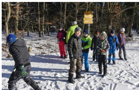
Radovánky ve sněhu.