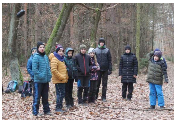
Hod cvičným granátem do dálky.

Po jídle jsme se vrátili na rybník a hráli jsme další hru. Tentokrát to byla však družinová hra. Byla to hra, kterou jsme nazvali přebíhání na ostrůvek. Na rybníku, na kterém jsme byli, se totiž nachází menší ostrůvek, ke kterému jsme běhali ze břehu. Hra se hrála tak, že vždy nastoupily dvojice ze všech týmů, jeden z dvojice zůstal u břehu a ten druhý na něj čekal u ostrůvku. Hra se odstartovala a ti, co byli u břehu, vyběhli po ledu směrem k druhému člověku, který na něj čekal u ostrůvku, tam předal štafetu a ten, co byl u ostrůvku, běžel zpátky ke břehu. Bod získával tým, jehož člen, který stál ze začátku hry u ostrůvku, doběhl jako první ke břehu. Když se vystřídali všichni tak, že byli všichni ve dvojici se všemi ze svého týmu, tak se hra ukončila. Tuto hru vyhráli Mufici.