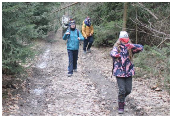
Při letadlech v mlze.